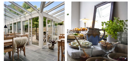
Hotel Aahøj, Sæby