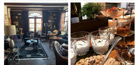
Park Hotel, Frederikshavn